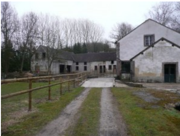
passerelle privée permettant l'accès au moulin

Parmi les idées du projet: la création d'un pont d'une capacité de 16 tonnes alors que le pont sur une voie publique à l'entrée de la propriété n'offre, sauf erreur, qu'une capacité d'environ 5 tonnes et qu'une passerelle privée desservait le moulin.passerelle